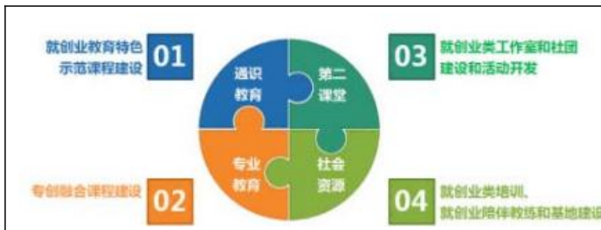
图3: 全程化的就业创业课程思政育人模式

为了全面融入, 我们构建了全程化的就业创业课程思政育人模式, 如图3所示, 在就业创业课程体系的每个层次都有思政元素的体现, 并且侧重不同, 授课教师可以根据这个指导, 融入到每门课程中。这样思政知识点会覆盖的更加全面, 避免了过于集中, 重复的情况。